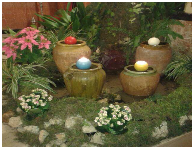
V Centenario del Nacimiento de Santa Teresa de Jesús