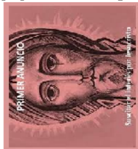
PRIMER ANUNCIO Suares, J. / Luz y Vida / Luz y Vida

La aceptación del PRIMER ANUNCIO, que invita a dejarse amar por Dios y a amarlo con el amor que El mismo nos comunica, provoca en la vida de la persona y en sus acciones una primera y fundamental reacción: DESEAR, BUSCAR Y CUIDAR EL BIEN DE LOS