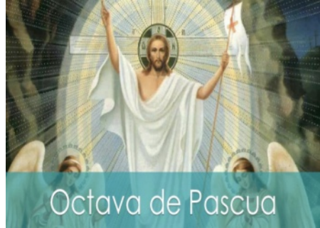
Octava de Pascua

El tiempo litúrgico de la Pascua tiene como duración