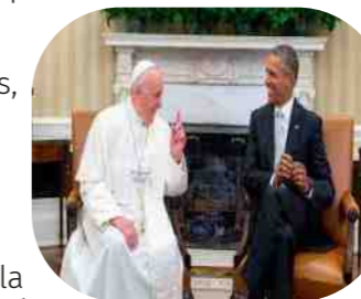
Analloris ÁREA FORMACIÓN

¡Ruego al Señor que nos regale más políticos a quienes les duela de verdad la sociedad, el pueblo, la vida de los pobres!