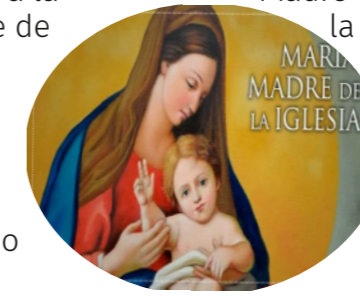
Madre la Madre de la Iglesia

Contemplamos a la Iglesia, a la Madre de cada uno de nosotros. Ella nos irá enseñando cómo es esta maternidad nos lleva a ser discípulos, cómo esta maternidad no se realiza sino mediante una actitud de acogida silenciosa, pobre y contemplativa de la Palabra de Dios. Que la contemplación de la Madre vaya dando unidad interior a nuestra vida. Se la pedimos a nuestra Señora: